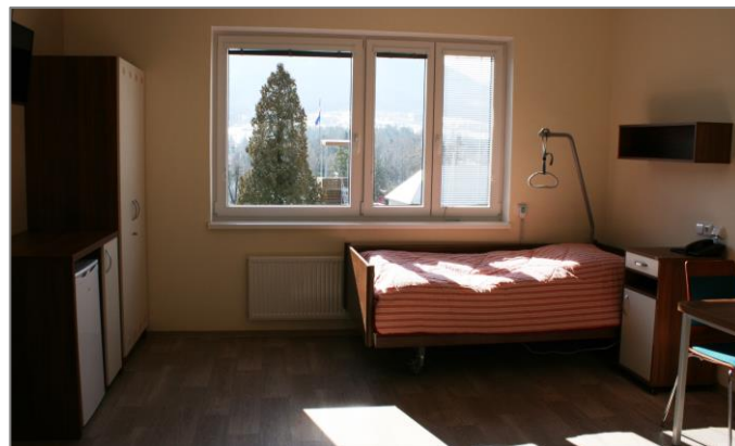
Jeden z pokojů s polohovacím lůžkem s antidekubitní matrací