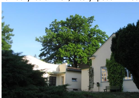
Dub letní za restaurací U Sestřiček, foto z jara roku 2009

Ještě větší radost máme z toho, že hodně z Vás hned navrhovalo příštího kandidáta do této soutěže, který by byl skutečně „NÁŠ“ - je to mohutný DUB LETNÍ, který roste v těsné blízkosti zadního traktu provozní budovy (sklad, dílny, prádelna). Jde o strom skutečně pozoruhodný: jeho stáří je 170 až 200 let, výška 22m, šířka koruny 12m a obvod kmene přes 4m. Tyto údaje čerpáme z návrhu na jeho vyhlášení za Památný strom ČR, který podali v roce 2008 činovníci místní organizace Svazu ochránců přírody v Kunčicích pod Ondřejníkem a ing. Jan Folprecht, mimo jiné autor publikace „Lázně Skalka“. V návrhu je rovněž uvedeno, že by tento dub mohl nést jméno MUDr. Maye, zakladatele Lázní Skalka. V těsné blízkosti „našeho“ dubu, který byl již v té době vzrostlým stromem, se totiž nacházely budovy původního Statku. Když jsme získali podpis pana ředitele do hlasovacího archu na podporu jasanu, shodli jsme se v tom, že dubu i BRC by podobná propagace v anketě také slušela, jistě by ho podpořili svým podpisem nejen zaměstnanci, ale i spousta pacientů.