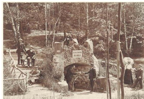
Z dob počátků lázeňství v Čeladné...